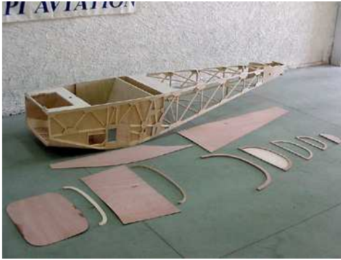
( kit avancé )