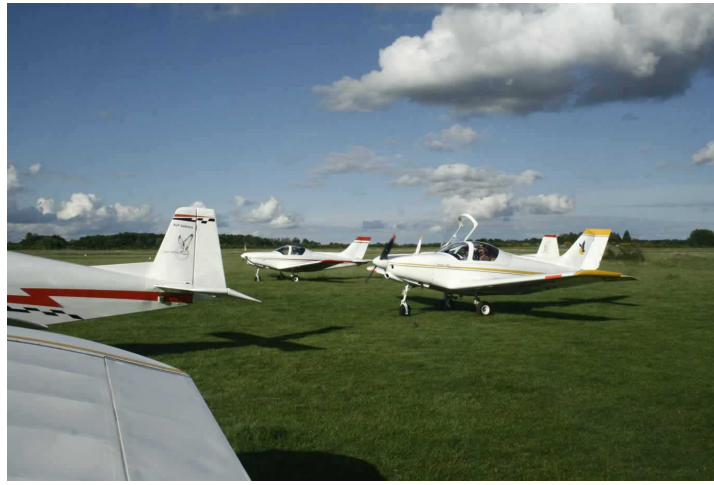
Equipement aux normes aéronautiques